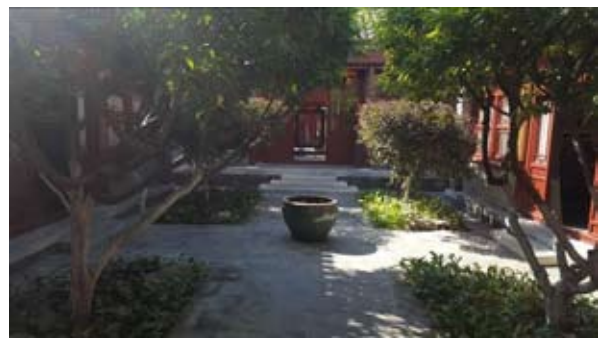
Рис. 2. Каменная горка в парковой зоне.

На территории парка расположены разнообразные кустарники и деревья различного возраста. При первоначальной планировке в саду располагались два читальных зала в которых хранилось более пяти тысяч книг.