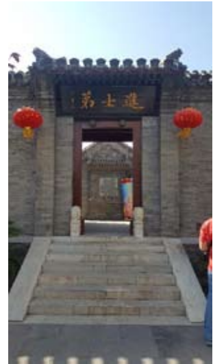
Рис. 4. Вход в жилую зону.

и внутренние дворы имеют различные размеры. В южной части резиденции расположены два дворика, включающие религиозные и жилые постройки: комната буддизма, первый выставочный павильон, холл Кун Пху, гостиная, зал эстетической подготовки и сезонный выставочный павильон [7, 9]. Сооружения, расположенные в центральной, северной и восточной частях поместья имеют преимущественно образовательные и коммерческие функции: банк Тонг Да, открытый павильон, комната для важных гостей, читальный зал в китайском стиле, читальный зал в западном стиле и кабинет. В западной части расположены бытовые помещения. С момента последней реставрации усадьбы во все помещения помещены предметы интерьера и человеческие фигуры, говорящие о функциях каждого сооружения [9].