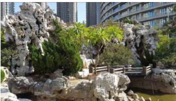
Рис. 1. Внутренний дворик в жилой зоне.