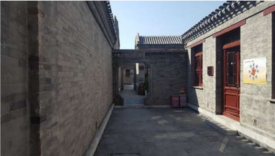
Рис. 3. Внутренний дворик в жилой зоне.