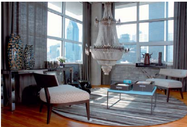
Рис. 1. Квартира архитектора Франсуа Симара в Монреале. Сайт журнала Elle Decoration от 28 мая 2015 г. https://www.elledecoration.ru/interior/flats/interer-kvartiryi-studii/

Отличным примером использования художественного ворсового текстиля может служить интерьер квартиры архитектора Франсуа Симара в Монреале [2]. Центральная часть квартиры представляет собой двусветное пространство с множеством функциональных зон: от каминной до проходной зоны с лестницей. Большой ковер на полу прекрасно выполняет функцию зонирования, обозначая диванную зону гостиной. Объединяя значительную мебельную группу и отдельные элементы декора в единую пространственную композицию, ковер при этом не претендует на роль декоративного акцента в интерьере, чего нельзя сказать о круглом ковре, расположенном в камерной зоне для бесед тет-а-тет. Своим активным геометрическим орнаментом он отлично завершает своеобразную интерьерную инсталляцию из двух кресел и массивной классической люстры (рис. 1) В данном случае мы можем говорить о художественном текстиле как о важном компоненте декоративного ансамбля в современном интерьере наряду с дизайнерской мебелью, аутентичной керамикой и антикварной люстрой.