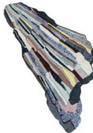
Рис. 6. Bethan Laura Wood. Серия ковров Super Fake. Фото в интерьере.