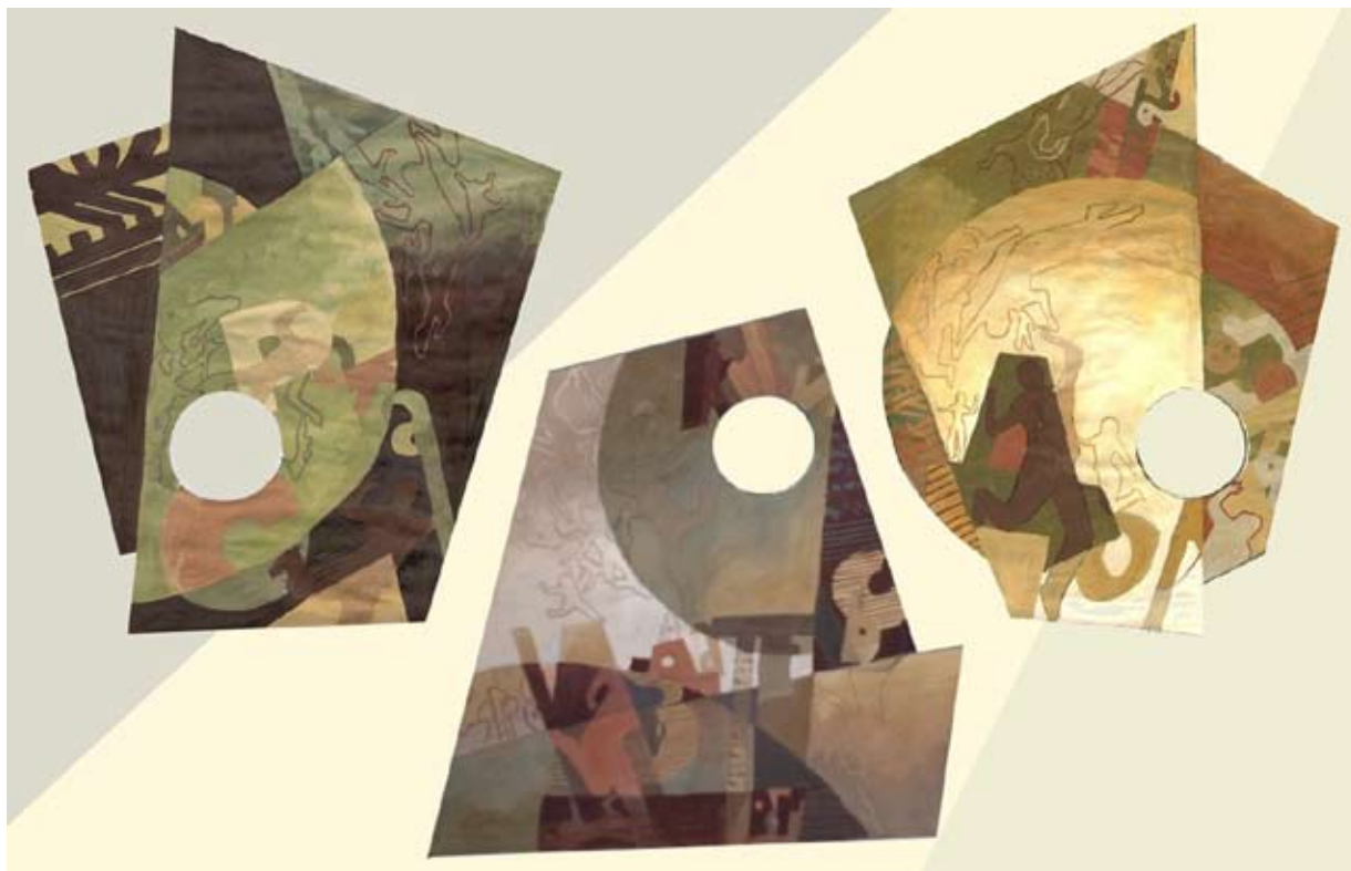
Рис. 8. П. Пономарева. Проект текстильного оформления холла издательского дома «Сорока». Эскизы серии ковров

рести изобразительную основу. Другой важнейшей задачей, решаемой автором проекта, стала необходимость сделать огромное пространство сомасштабным человеку. Поэтому была предложена состоящая из пяти фрагментов сложная композиция, отвечающая заявленной теме и создающая неповторимый образный ряд (рис. 9). Объем фактуры в ковре играет в изобразительной композиции ключевую роль. За счет разницы высоты ворса текстиль смотрится убедительно не только вблизи, но и с верхних этажей атриума (рис. 10). Данный проект был признан профессиональным сообществом, получив высокую оценку на конкурсе дипломных проектов МООСАО в 2011 г.