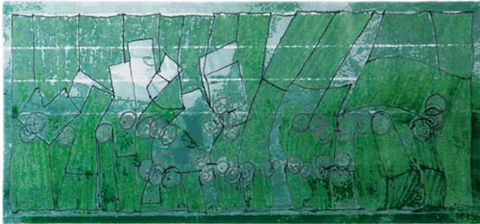
Рис. 4. Frank Gehry. Ковер Green Rug из серии Frank Gehry Collection. Сайт Ferreira de Sa https://ferreiradesa.pt/productdet.php?o=c&c=6&t=ht&i=141

много подобных примеров трансформаций станкового искусства в декоративные композиции интерьерного тканого текстиля, а также оригинальных творческих концепций, которые вполне могли быть воплощены в любом другом виде изобразительного искусства.