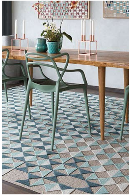
Рис. 5. Trine Kielland. Ковер Deltille. Фото в интерьере.

главное и второстепенное, определить центр и периферию композиции, даже преимущество, какого-либо цвета неочевидно. Ключом к разгадке данного произведения, а точнее серии произведений, служит интерьерное пространство, предлагаемое художником как «среда обитания» для данного текстиля (рис. 6). Интерьер абсолютно атектоничен, как и текстильные композиции. Но в отличие от ковров, из интерьера совершенно изъят цвет. Отсутствие твердого представления о том, где верх и где низ, в данном пространстве дополняется бестелесностью металлической фольги, на фоне которой экспонируются текстильные композиции. Контраст фактурности ворса и блеска металла, цветовой палитры ковра и монохромности пространства делает присутствие текстиля в данном пространстве жизненно необходимым. Можно сказать, что серия ковров оправдывает существование данного интерьера, наполняет его смыслом, и смыслом очень художественным.