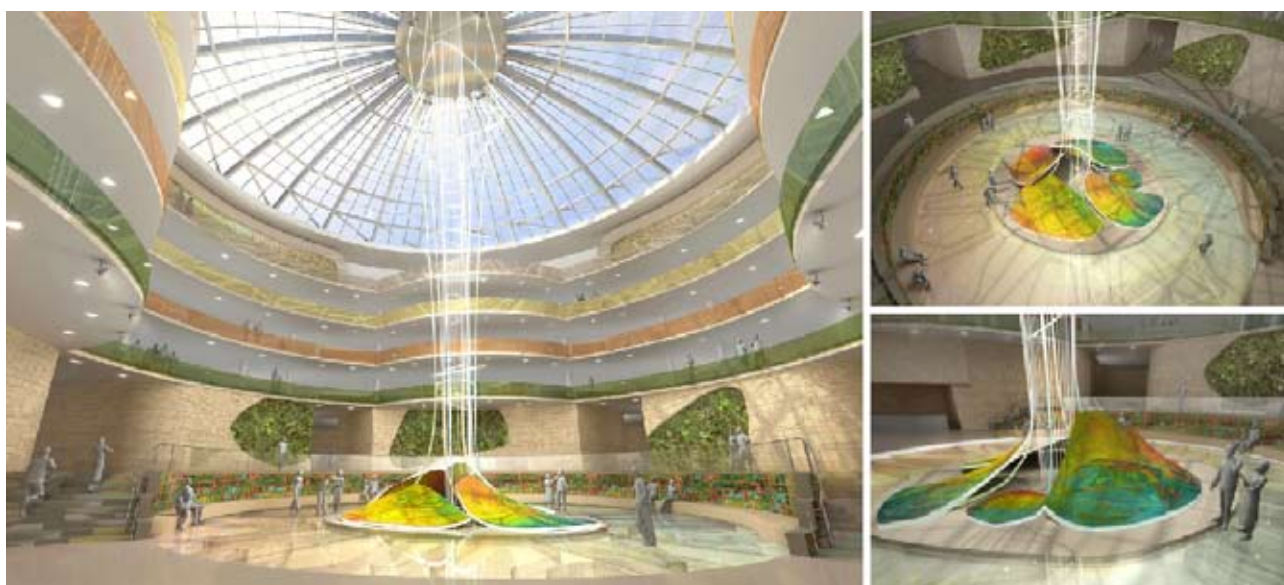
Рис. 9. М. Семейкина. Проект текстильного оформления атриума Музея биосферы. Виды интерьера

рести изобразительную основу. Другой важнейшей задачей, решаемой автором проекта, стала необходимость сделать огромное пространство сомасштабным человеку. Поэтому была предложена состоящая из пяти фрагментов сложная композиция, отвечающая заявленной теме и создающая неповторимый образный ряд (рис. 9). Объем фактуры в ковре играет в изобразительной композиции ключевую роль. За счет разницы высоты ворса текстиль смотрится убедительно не только вблизи, но и с верхних этажей атриума (рис. 10). Данный проект был признан профессиональным сообществом, получив высокую оценку на конкурсе дипломных проектов МООСАО в 2011 г.