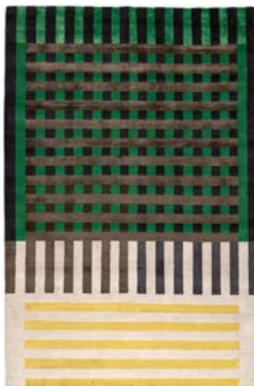
Рис. 2. Christopher Kane. Ковер Grid Construct. Сайт The Rug Company https://www.therugcompany.com/int-ru/catalog/product/view/id/22018/s/grid-construct-4570/category/12/

История изобразительного искусства в целом и дизайна в частности знает много примеров произведений, ставших «культовыми» по тем или иным причинам. Не вдаваясь в подробности механизма возникновения статуса «культовости» отдельных авторов и их произведений, хотелось бы обозначить одну из важнейших тенденций современного проектирования, а именно – постоянное создание новых произведений по мотивам тех или иных шедевров дизайна. Ковровый текстиль также подвержен в какой-то степени этому направлению художественной деятельности. Дизайнер Кристофер Кейн создал для The Rug Company эскиз ковра Grid Construct по мотивам творчества шотландского архитектора и художника Чарльза Макинтоша (рис. 2). Композиционный рисунок ковра явно ассоциируется со знаменитыми стульями и креслами Макинтоша, ставшими своего рода символами дизайна начала XX в. Решетчатая структура отлично подчеркивается ворсом разной длины, а также активным тоновым контрастом локаль-