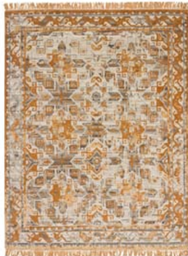
Рис. 3. Ковер Traces de Kazak.

Итальянская фабрика CC-Tapis выпустила целую коллекцию ковров под названием Traces de memoire, что можно перевести как «следы воспоминаний». Ковры, входящие в данную серию, представляют собой орнаментальные композиции, выполненные в материале с эффектом «утраченности». Каждый ковер серии демонстрирует фрагмент той или иной исторической художественной культуры через символический элемент. Например, Traces de Damask представляет собой часть раппортной композиции на основе такого элемента классического декора, как дамаск, пришедшего в европейскую художественную культуру из орнаментов Ближнего Востока. А ковер Traces de Kazak – это своего рода компиляция из традиционных малороссийских орнаментов (рис. 3). Такого рода произведения могут быть использованы как при создании интерьеров, воспроизводящих классические композиционные приемы и декор, так и в современном эклектичном интерьере.