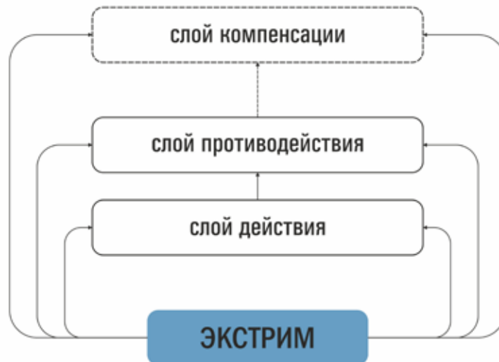
Рис. 1. Схема формирования туристского продукта в условиях среднего экстрима

Таким образом, Север диктует свои «правила игры» и требования к организации туристической деятельности – здесь в первую очередь важны вопросы безопасности: с одной стороны, это вопросы личного комфорта, безопасности и адаптации туриста в агрессивных природных условиях; с другой – это безопасность с точки зрения территории, что подразумевает экологию не только природную , но и культурную (термин Лихачева [11]). Так безопасность становится стержневым условием развития арктического туризма: от снятия физиологического и психологического дискомфорта при вхождении человека в новую непривычную среду до гарантии его выживания в экстремальной ситуации на маршруте и сохранения уникального природного и культурного облика территорий.