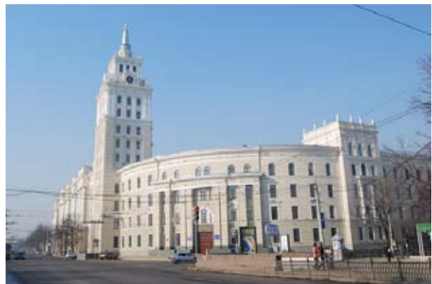
Рис. 10. Здание Управления ЮВЖД. Современное фото.