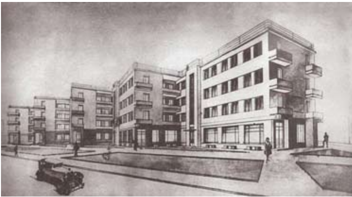
Рис. 9. Проект жилого дома «Гармошка». 1928

Не менее интересен и другой проект Н.В. Троицкого – здание, расположенное на углу ул. К. Маркса (ранее – Большая Садовая) и ул. Студенческой. Дом необычной формы был спроектирован в 1928 г. в стиле конструктивизма – с плоской кровлей, ленточным остеклением. В народе здание прозвали «гармошкой», потому что оно построено пятью углами-зигзагами. Во время войны дом-гармошка пострадал, однако был восстановлен автором в прежних объемах, но в стиле неоклассицизма.