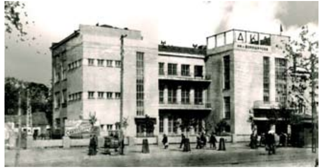
Рис. 4. Дом Красной Армии им. Ворошилова. Фото 1930-х гг.

Изменение направленности советской архитектуры после принятия в 1932 г. Постановления Политбюро ЦК ВКП(б) "О перестройке литературно-художественных организаций" [3] послужило причиной того, что в Воронеже в соответствии с новой архитектурной доктриной одним из первых подверглось стилистическому преобразованию одноэтажное здание Коммерческого банка, расположенного в самом центре города (рис. 5). Построенное в 1880 г. по проекту архитектора С.Л. Мысловского, в 1935 г. оно было реконструировано по проекту архитектора Н.В. Троицкого (рис. 6).