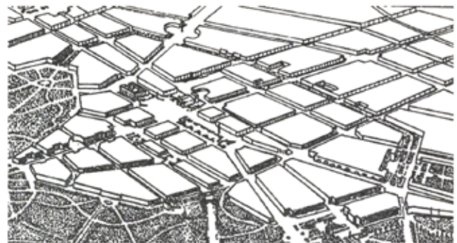
Рис. 2. Перспектива к проекту центра. Арх. Л.В. Руднев, 1945 [5]

Эти документы предусматривали сохранение исторически сложившейся планировки, системы улиц и площадей, а также создание на новых территориях крупных кварталов, а в старых районах – укрупнение кварталов и придание им более четкой геометрической формы [2].