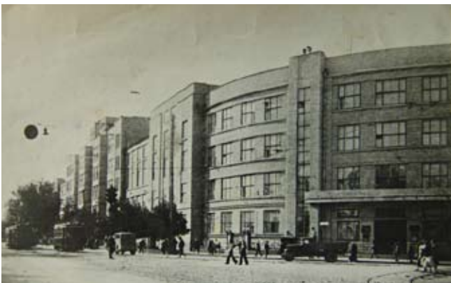
Рис. 9. Здания МДЖД и ЮВЖД. Довоенное фото. Из архива автора

Поражали не только внушительные размеры этого административного сооружения, выходившего на три улицы, ограничивавшие квартал застройки (пр. Революции, ул. Университетскую и ул. Фридриха Энгельса), но и фасады без каких-либо деталей с большими остекленными поверхностями. В том же квартале и в том же стиле было построено здание Управления Московско-Донбасской железной дороги (рис. 9).