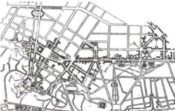
Рис. 1. Проект детальной планировки центра Воронежа. Арх. Л.В. Руднев [5]

Восстановление Воронежа началось сразу после его освобождения от немецко-фашистских захватчиков 25 января 1943 г. Требовались чрезвычайные меры и особые принципы восстановления, которые были выработаны и нашли отражение в ряде документов, в первую очередь, в Генеральном плане города и проекте детальной планировки центра (рис. 1, 2), разработанных под руководством академика архитектуры Л.В. Руднева и утвержденных 19 ноября 1946 г. Советом Министров РСФСР.