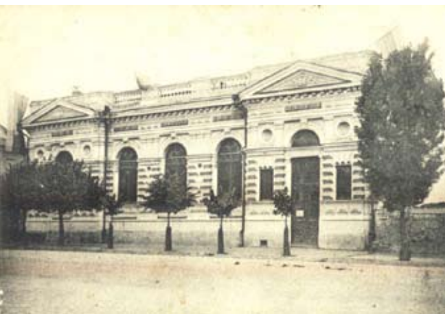
Рис. 5. Здание Коммерческого банка. Открытка нач. XX в.

Изменение направленности советской архитектуры после принятия в 1932 г. Постановления Политбюро ЦК ВКП(б) "О перестройке литературно-художественных организаций" [3] послужило причиной того, что в Воронеже в соответствии с новой архитектурной доктриной одним из первых подверглось стилистическому преобразованию одноэтажное здание Коммерческого банка, расположенного в самом центре города (рис. 5). Построенное в 1880 г. по проекту архитектора С.Л. Мысловского, в 1935 г. оно было реконструировано по проекту архитектора Н.В. Троицкого (рис. 6).