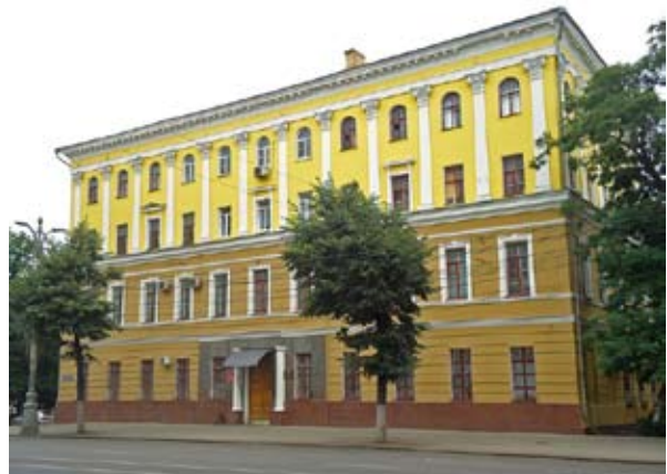
Рис. 8. Здание Казенной палаты. Современное фото.

Изначально двухэтажное здание Дома казенной палаты, возведенное во второй половине XVIII в. по проекту Джакомо Кваренги в стиле классицизма как часть планируемого, но не осуществленного комплекса из четырех зданий наместнического правления и губернских присутственных мест (рис. 7) после Великой Отечественной войны дополнили двумя жилыми этажами [4]. Архитектор А.В. Миронов придал новому объему здания классический вид, сохранив общий стилистический характер, заданный Кваренги (рис. 8).