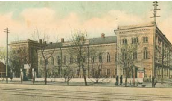
Рис. 3. Мариинская женская гимназия. Открытка начала XX в.

Так, в довоенном Воронеже здание бывшей Мариинской женской гимназии (рис. 3), построенное в 1875 г. по проекту архитектора В. Е. Переверзева в стиле историзма и приспособленное после революции под Дом Красной Армии, было перестроено в 1931 г. по проекту архитектора Я.А. Корнфельда в конструктивистском стиле (рис. 4).