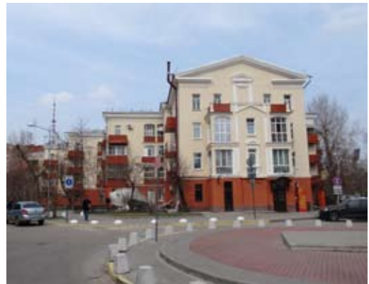
Рис. 10. Жилой дом «Гармошка». Современное фото.

Стилистические изменения затронули и учебный корпус Воронежского инженерно-строительного института, который изначально перед войной был построен Н.В. Троицким в стиле конструктивизма. Однако после Великой Отечественной войны автор «передел» его в неоклассические «одежды», так же как здание Управления ЮВЖД и дом «Гармошка».