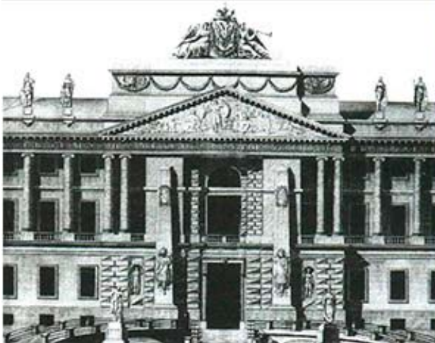
Рис.19. В. Бренна. Проектный вариант главного фасада Михайловского замка в Санкт-Петербурге. Около 1800 г. Гравюра резцом И.И. Колпакова. Деталь.