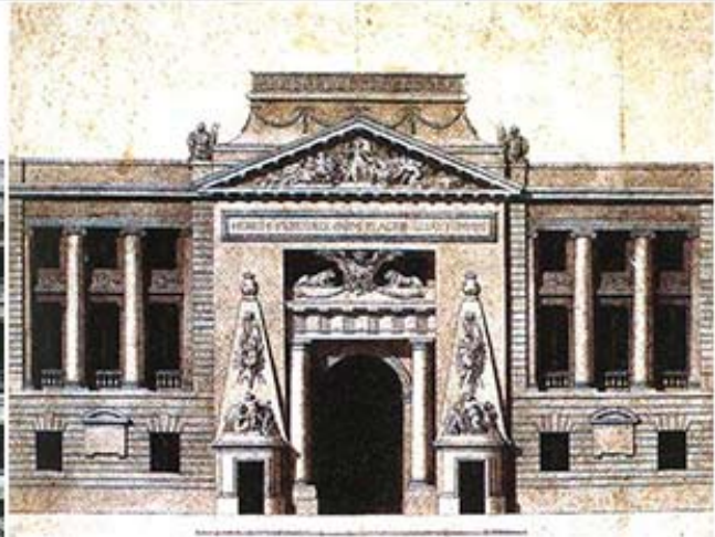
Рис.20. А. Петито. Проект главного фасада Герцогского дворца в Парме. 1760-е гг. Бумага, перо, тушь, акварель. Парма, Музей Глауко Ломбарди.

Посредством ряда исторических мотивов, цепочки метафор, метонимий и символических значений образ Михайловского замка коррелирует в нашем представлении с историей архитектуры, трагической судьбой императора и, может быть, всей России. Форма обелиска мысленно отсылает нас к истории: через пафос искусства древнеримской империи к Египту, а военные трофеи – в обратном направлении: от Греции и Рима к событиям эпохи наполеоновских войн и правления императора Павла. И это не эклектика, и не стилизация, а целостная композиция, скрепленная исторической памятью и воображением интеллектуального зрителя. Осмысленное и переживание архитектурного образа осуществляется не по стадиям композиционного процесса архитектора от простого к сложному, и не в соответствии с формальной эволюцией такого типа сооружений, а в иной последовательности: зритель реконструирует первообразы последовательно в глубь веков, мысленно возвращаясь к источникам композиции. Архитектор делает это интуитивно, облекая образы подсознания в материальную форму, а зритель – сознательно расшифровывая знаки и символы.