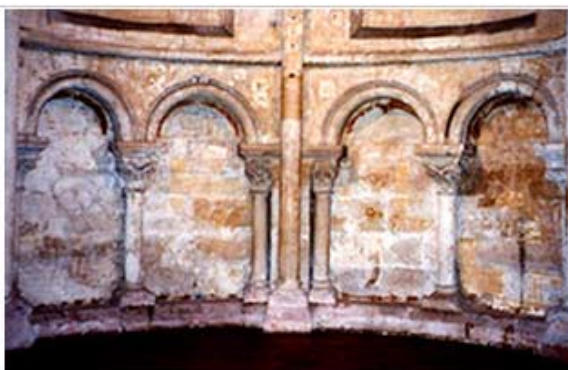
Рис.14. Базилика Сен-Жермен де Пре в Париже. Слепая аркатура деамбулатория. XII в.

Мнемоническим зеркалом истории архитектуры является композиция Камероновой галереи в Царском Селе близ Санкт-Петербурга (1783–1787) – чудо искусства и тонкости художественного вкуса шотландца Чарлза Камерона. Легкая «греческая» колоннада вознесена на подиум, стилизованный под древнеримскую руину. Источником этой идеи справедливо считают римские рисунки Ш.-Л. Клериссо, гравюру Дж. Б. Пиранези «Мост Фабрицио в Риме» и мотив нескольких картин Ю. Робера (рис. 15–17). Нижний ярус галереи облицован тесаным пудожским камнем с подчеркнута грубой фактурой и якобы полустертыми от времени деталями. На таком