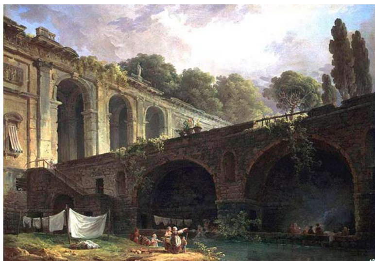
Рис. 17. Ю. Робер. Вилла Мадама под Римом. 1767. Холст, Масло. Санкт-Петербург, Государственный Эрмитаж.

Примером комбинаторного мнемонического мышления является композиция южного фасада Михайловского замка в Санкт-Петербурге (дворца императора Павла I, 1797–1800). В композиции петербургского замка угадываются очертания триумфальных ворот Сен-Дени в Париже, возведенных в 1672 г. по проекту Ф. Блонделя Старшего, основоположника французского академического классицизма. Колоннада большого ордера боковых частей южного фасада напоминает Колоннаду Лувра – работу К. Перро в Париже. По сторонам портала, как и в воротах Сен-Дени, к фасаду прислонены два обелиска с римскими воинскими арматурами и добавленными вензелями Павла I.