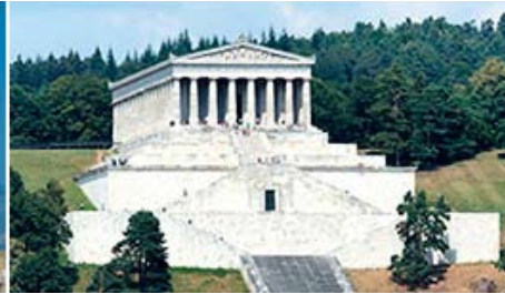
Рис.2. Вальгалла. Зал Славы германской нации. 1830–1842. Арх. Л. фон Кленце.

Постройка XIX в., Вальгалла на Дунае (Зал Славы германской нации), воспроизводит древнегреческий (языческий) храм – Парфенон афинского Акрополя (рис. 1, 2). В данном случае художественная идея сооружения заключается в воспроизведении прототипа, имеющего иной историко-культурный смысл. При этом содержание меняется за счет расширения образного смысла, но форма остается неизменной. Другой пример: вступая в величественный интерьер Казанского собора в Санкт-Петербурге постройки А.Н. Воронихина (1801–1811), невольно вспоминаешь античность и, несмотря на различие ордеров, колоннаду Парфенона (рис. 3). Такая ассоциация носит архитектурно-мнемонический, но не стилевой и, тем более, не литургический характер. Башня Городской думы на Невском проспекте в Санкт-Петербурге представляет собой репликацию в классицистических формах традиционной итальянской кампанилы (колокольни), однако ее использовали в качестве пожарной каланчи и для оптического телеграфа, что изначально не имелось в виду. Художественная функция башни – выявление значимости места посредством зрительной доминанты в ансамбле Невского проспекта (рис. 4).