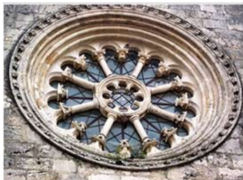
Рис.13. Церковь Сан-Хуан-де-Альпорао. Сантарен, Португалия. XII в. Роза главного фасада.