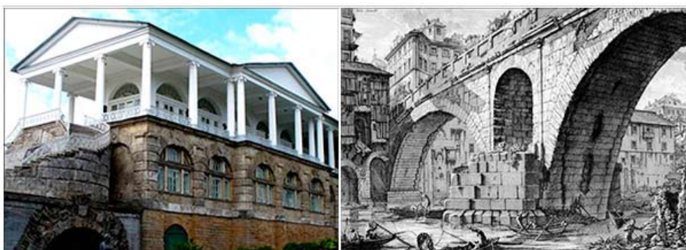
Рис. 15. Камеронова галерея в Царском Селе. Вид с северо-востока. 1783–1787. Арх. Ч. Камерон.

подиуме легко парит белоснежная колоннада ионического ордера с широко расставленными колоннами (редко встречающийся ареостиль, типичный для ранней этрусской архитектуры с деревянными перекрытиями). Контраст легкой колоннады и массивного цоколя создает мощный живописный эффект. В колоннаде Камерон не просто воспроизвел греческий ионический ордер, а скопировал любимый им ордер Эрехтейона афинского Акрополя с необычно высокой, стройной капителью. Контраст этой цитаты с нарушающей канон широкой расстановкой колонн усиливает остроту сочетания дерзости и изящества, традиции и новаторства, широты и утонченности.