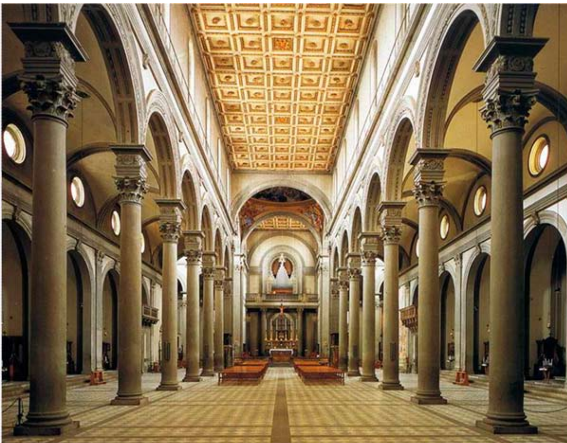
Рис.10. Церковь Сан Лоренцо во Флоренции. Интерьер. 1420–1423. Арх.Ф. Брунеллески.

Л. Б. Альберти в трактате «Десять книг о зодчестве» (1444–1452) писал, что древние римляне знали прием опоры арок на капители колонн, но не пользовались им ввиду непрочности такой конструкции. Древнеримские аркады по принципу «архитектурной ячейки» (арки опираются на пилоны, а колонны приставлены спереди для украшения) производят впечатление массива стены с проемами (табл. 1). Брунеллески создал новую тему, произведя на свет образ свободно стоящих колонн и «летающих» арок. Эта прекрасная идея, отражающая дух эпохи Возрождения, в дальнейшем стала характерным почерком работы итальянских архитекторов, в том числе за пределами страны. Брунеллески продемонстрировал свое изобретение в интерьерах церкви Сан Лоренцо (1420–1423, рис. 10) и Санто Spirито (1436–1444), в лоджии Ospedale della Scala (1424) во Флоренции.