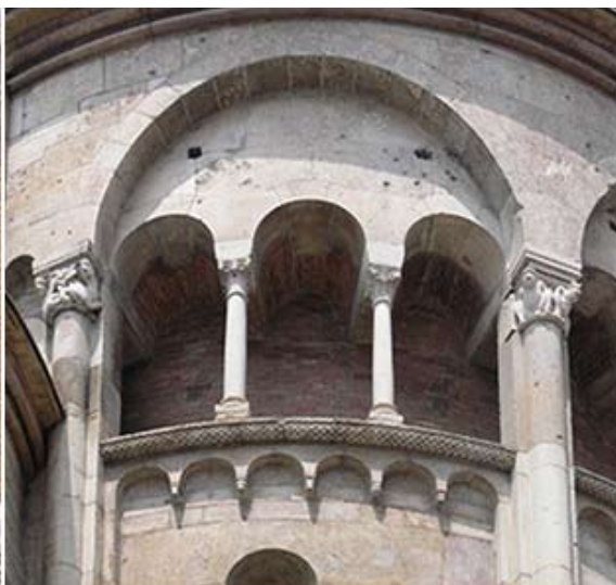
Рис.12. Собор в Модене. Эмилия-Романья, Италия. XII–XV в. Деталь аркатуры апсиды.