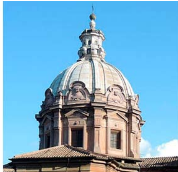
Рис.9. Церковь Св. Луки и Мартины на Римском форуме. Деталь. 1588–1634. Арх. Пьетро да Кортона.

В мнемонике складывается особенная цепочка мотивных значений, облегчающих не только восприятие памятника в историческом контексте, но и раскрывающих актуальный смысл каждой детали. Благодаря реминисценции возникает уникальный архитектурный язык: метафорически-образительный, ассоциативный и визуально-символический. Правильное понимание соотношений идеи, темы и мотива в архитектуре сопряжено с феноменологическим и психологическим аспектами. Так, Х. Зедльмайр, один из основоположников структурного анализа в искусствознании, использовал в этом контексте определение В. Пиндера «формальный повод». Зедльмайр писал: «То, что форма базилики встречается в определенном историческом месте и в определенное время, может констатировать человек, совершенно не восприимчивый к искусству. Но он окажется несостоятельным, если объяснить, почему она появляется именно здесь и теперь, можно будет только в силу понимания художественных свойств этой формы – иными словами, если речь идет не об абсолютной форме, но о форме как носителе художественных качеств – о форме как о мотиве, т. е. не как о пустой абстрактной схеме, но как о конкретно-наглядном гештальте, строящем художественное произведение» [23].