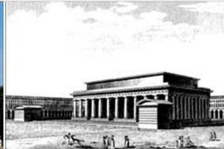
Рис.7. К.-Н. Леду. Проект здания для общественных нужд. 1792. Гравюра из издания «L'architecture considérée sous le rapport de l'art, des moeurs et de la législation: Écrits et propos sur l'art». Paris, 1804.

Понятия темы и мотива достаточно полно изучены в живописи, графике, скульптуре, иконописи и фреске. Там они чаще рассматриваются в качестве внешних, заданных условий (тема, сюжет) и иконографических источников (мотив) конкретной композиции, извода, канона. При этом тема произведения искусства (греч. thema – положенное, установленное), согласно иерархическому принципу содержательно-формальной целостности, становится содержанием для новой формы – мотива (лат. motivus – подвижный).