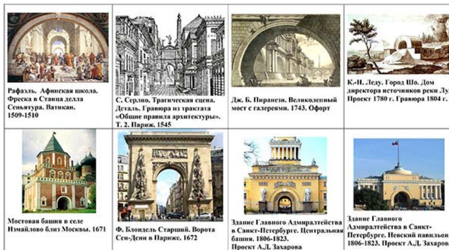
Таблица 2. Реминисцентные метаморфозы арчных композиций