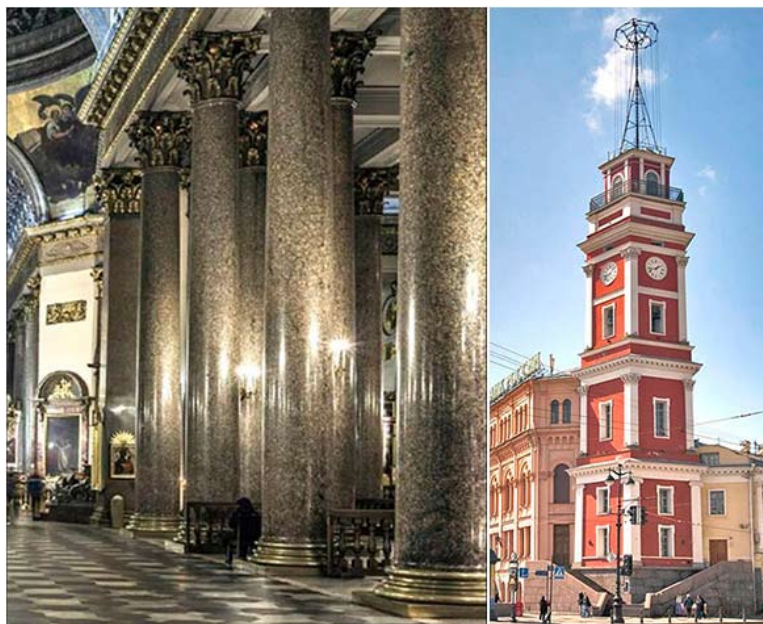
Рис.3. Казанский собор в Санкт-Петербурге. Деталь колоннады интерьера. 1801–1811. Арх. А. Н. Воронихин.

Постройка XIX в., Вальгалла на Дунае (Зал Славы германской нации), воспроизводит древнегреческий (языческий) храм – Парфенон афинского Акрополя (рис. 1, 2). В данном случае художественная идея сооружения заключается в воспроизведении прототипа, имеющего иной историко-культурный смысл. При этом содержание меняется за счет расширения образного смысла, но форма остается неизменной. Другой пример: вступая в величественный интерьер Казанского собора в Санкт-Петербурге постройки А.Н. Воронихина (1801–1811), невольно вспоминаешь античность и, несмотря на различие ордеров, колоннаду Парфенона (рис. 3). Такая ассоциация носит архитектурно-мнемонический, но не стилевой и, тем более, не литургический характер. Башня Городской думы на Невском проспекте в Санкт-Петербурге представляет собой репликацию в классицистических формах традиционной итальянской кампанилы (колокольни), однако ее использовали в качестве пожарной каланчи и для оптического телеграфа, что изначально не имелось в виду. Художественная функция башни – выявление значимости места посредством зрительной доминанты в ансамбле Невского проспекта (рис. 4).