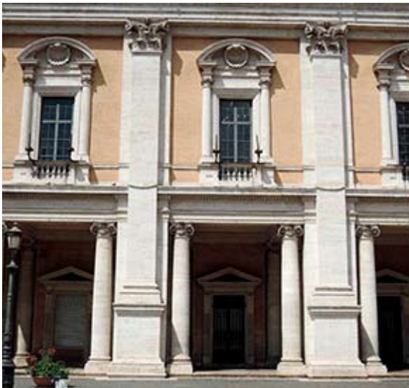
Рис.8. Палаццо Нуово на площади Капитолия в Риме. Деталь главного фасада. 1571–1654. Арх. Дж. и К. Райнальди по проекту Микеланджело Буонарроти.

Наиболее ярким примером мнемонической архитектуры являются здания Рима – «Главы мира» (лат. Caput Mundi ). По определению Гёте, Рим – это не город, а целый мир, в котором «взор объёмлет целое, доселе известное лишь по частям» [22]. Английский писатель Генри В. Мортон отметил, что «Рим – не открытие, а припоминание» («Прогулки по Вечному городу», 1957). Архитектор Тома де Томон назвал альбом своих рисунков-фантазий на античные темы «Вспоминание об Италии» (фр. « Souvenir d'Italie », 1800-е гг.). Только в Вечном городе отдельный портал, оконный наличник или даже подоконник могут отразить всю историю архитектуры. Многообразные сочетания колонн, пилястр различных ордоров, карнизов и арок – есть не что иное, как воспоминание об античности. Перед этим воспоминанием равны Ренессанс и барокко, маньеризм, неоренессанс и неоклассицизм. Внутри лучкового фронтона может оказаться треугольный или раковина, над ними – картуш с волютами или кронштейны с рокайлями. И это не эклектика, а мнемоника (рис. 8, 9).