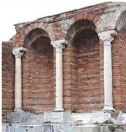
Рис.11. Дом Амура и Психеи. Деталь аркады. Остия Антика близ Рима. IVв.

Однако новацию Брунеллески нельзя считать изобретением в полном смысле этого слова. Ранние примеры можно найти в поздней античности, в памятниках романской архитектуры, аркатурно-колончатых поясах построек западноевропейского и восточноевропейского средневековья (рис. 11–14). Ближайшие аналоги итальянской «аркады по колоннам» имеются в арабской и испано-мавританской архитектуре. Через Венецию и Ломбардию этот восточный мотив, ранее известный в Византии, прижился на тосканской земле. Эти факты свидетельствуют об относительности хронотопических истин, условности их использования в датировках и искусствоведческих атрибуциях.