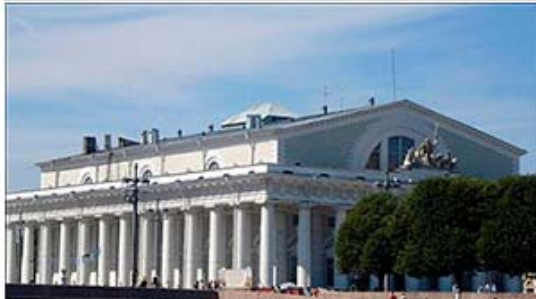
Рис.6. Ж.-Ф. Тома де Томон. Здание Биржи на стрелке Васильевского острова в Санкт-Петербурге. 1804–1810.

также черты сходства творения Томона с проектами зданий того же назначения французской Академии архитектуры: П. Бернара (Гран-при, 1782) и А.-Т. Броньяра (проект «Дворца Биржи», 1808–1809). И. Э. Грабарь обвинил Томона в плагиате идеи Бернара [18]; сходство проектов Томона и Броньяра находится в области ассоциативного восприятия зрителя.