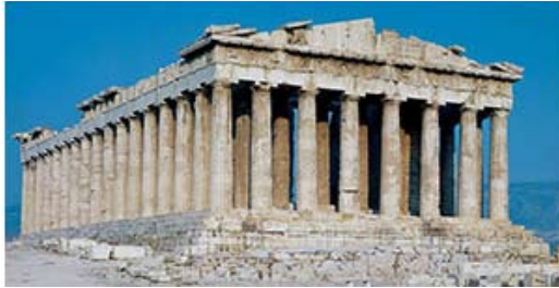
Рис.1. Парфенон афинского Акрополя. Вид с северо-запада. 447–438 гг. до н. э. Фидий, Иктин, Калликрат.

ет различать назначение постройки (функцию и конструкцию) и содержание архитектурного образа, который воспроизводит нечто, не связанное напрямую с назначением здания. Можно привести несколько очевидных примеров мнемонического содержания архитектуры.