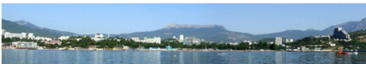
а) Восприятие с большого расстояния (1 км)