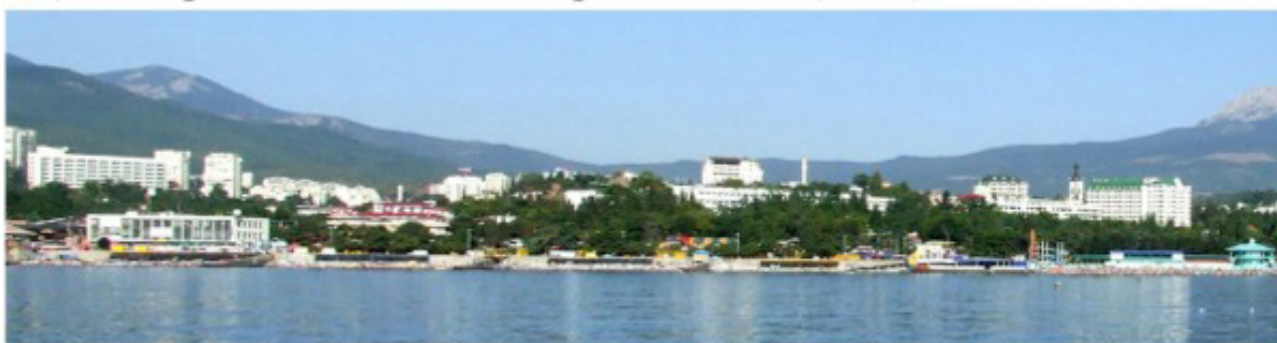
б) Восприятие со среднего расстояния (500 м)