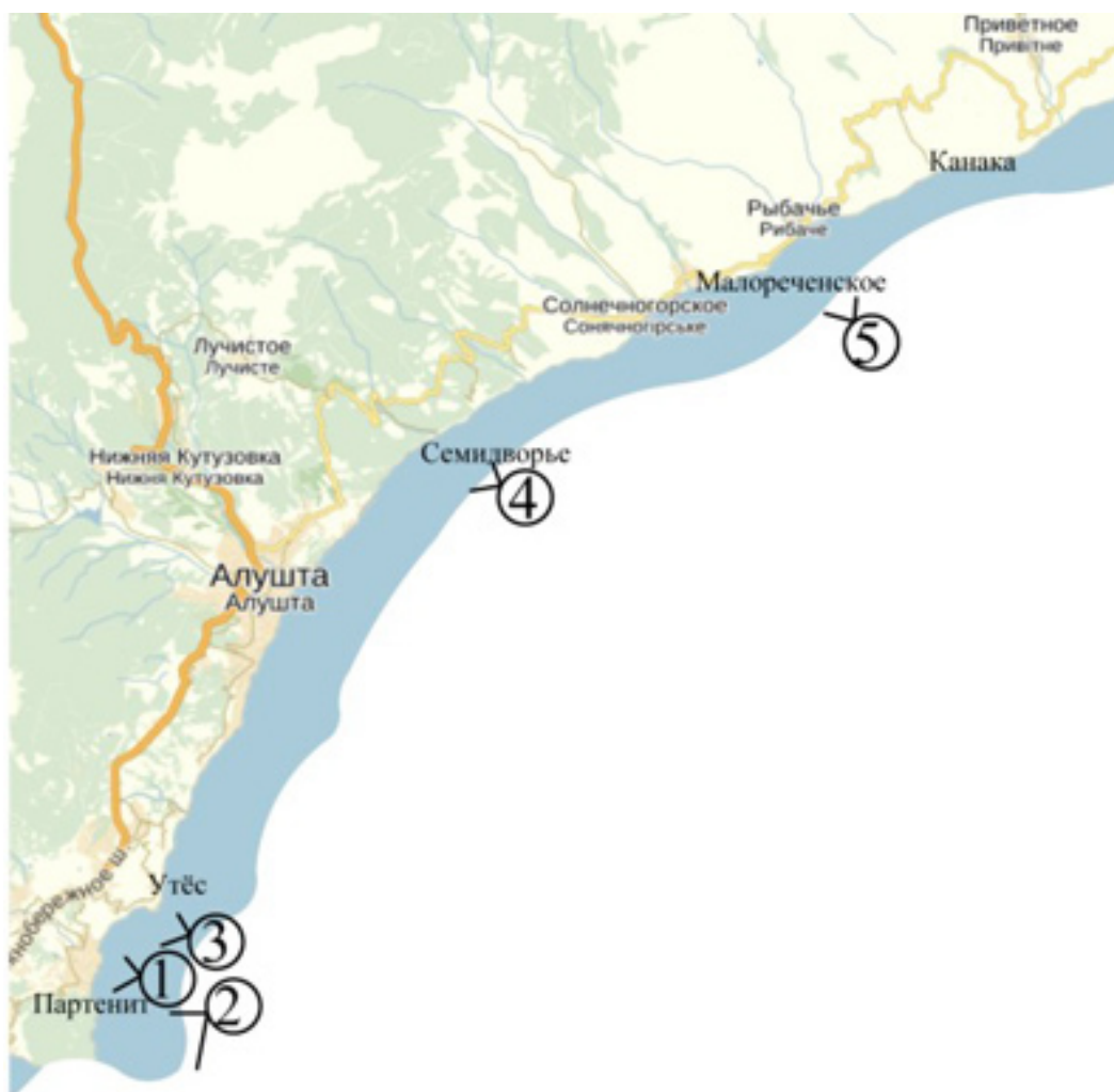
Схема курортного района Большая Алушта.

курорта большое значение имеют визуальные связи с морем. В приморском курорте здания курортно-оздоровительных учреждений являются акцентами, доминантами на панораме, о чем свидетельствует общий вид г. Алушты с моря (рис. 2).