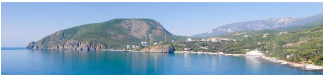
пгт. Партенит. Вид на гору Аю-Даг