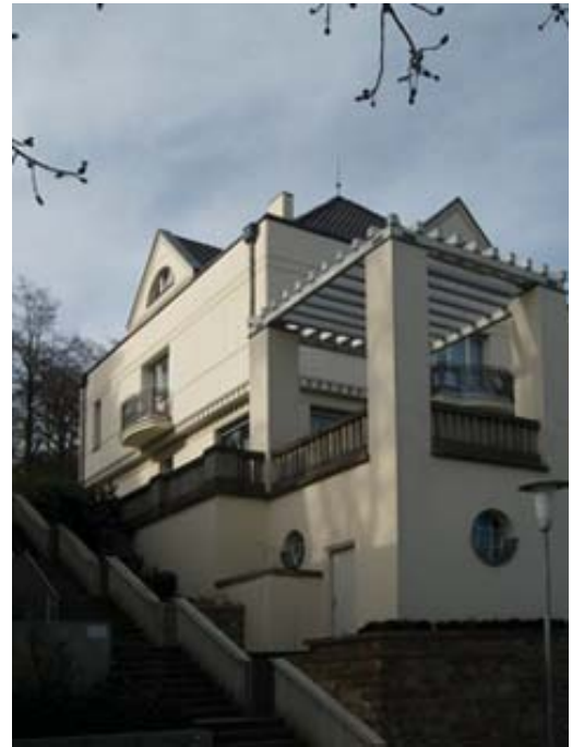
Рис. 2. П. Беренс. Вид дома Обенауэра. Саарбрюккен (1906): использование принципов классицизма

системно. Представители Марбургской школы неокантианства разработали учение о науке как о центре культуры, что позволило связать искусство с методологией науки. При этом они отвели искусству важную роль (в отличие от материалистов, позитивистов и прагматиков), считая, что оно призвано придать культуре гуманистический характер.