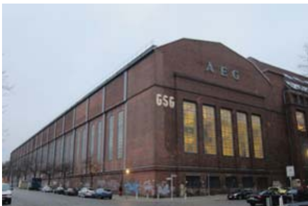
Рис. 3. П. Беренс. Вид турбинного цеха АЭГ. Берлин (1908–1909): архитектурный подход