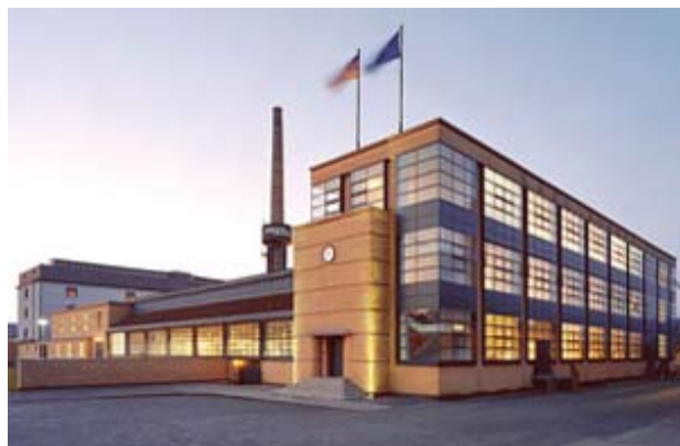
Рис. 4. В. Гропиус. Вид фабрики Фагус. Альфельд-на-Лайне (1910–1914): дизайнерский подход

[4, с. 52]). После череды экспериментов «национальным стилем» был провозглашен неоклассицизм, генетически связанный с эстетикой эпохи Просвещения. На первое место вышла воспитывающая функция архитектуры, и популярными стали проекты городов-садов, которые должны были способствовать «личной, творческой и гражданской эмансипации» людей. Неоклассицизм противопоставил господствовавшему югендстилю рациональность и принцип проектирования «снаружи внутрь»: интерьер понимался как внутренняя часть здания, а само здание рассматривалось в контексте городской застройки, что предполагало реализацию системного подхода к проектированию. Как справедливо замечает Т. Ю. Гнедовская, «искусство переставало быть образом жизни и становилось профессией» [4, с. 56].