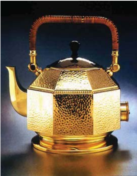
Рис. 5. П. Беренс. Чайник для АЭГ (1909): истоки индустриального дизайна.