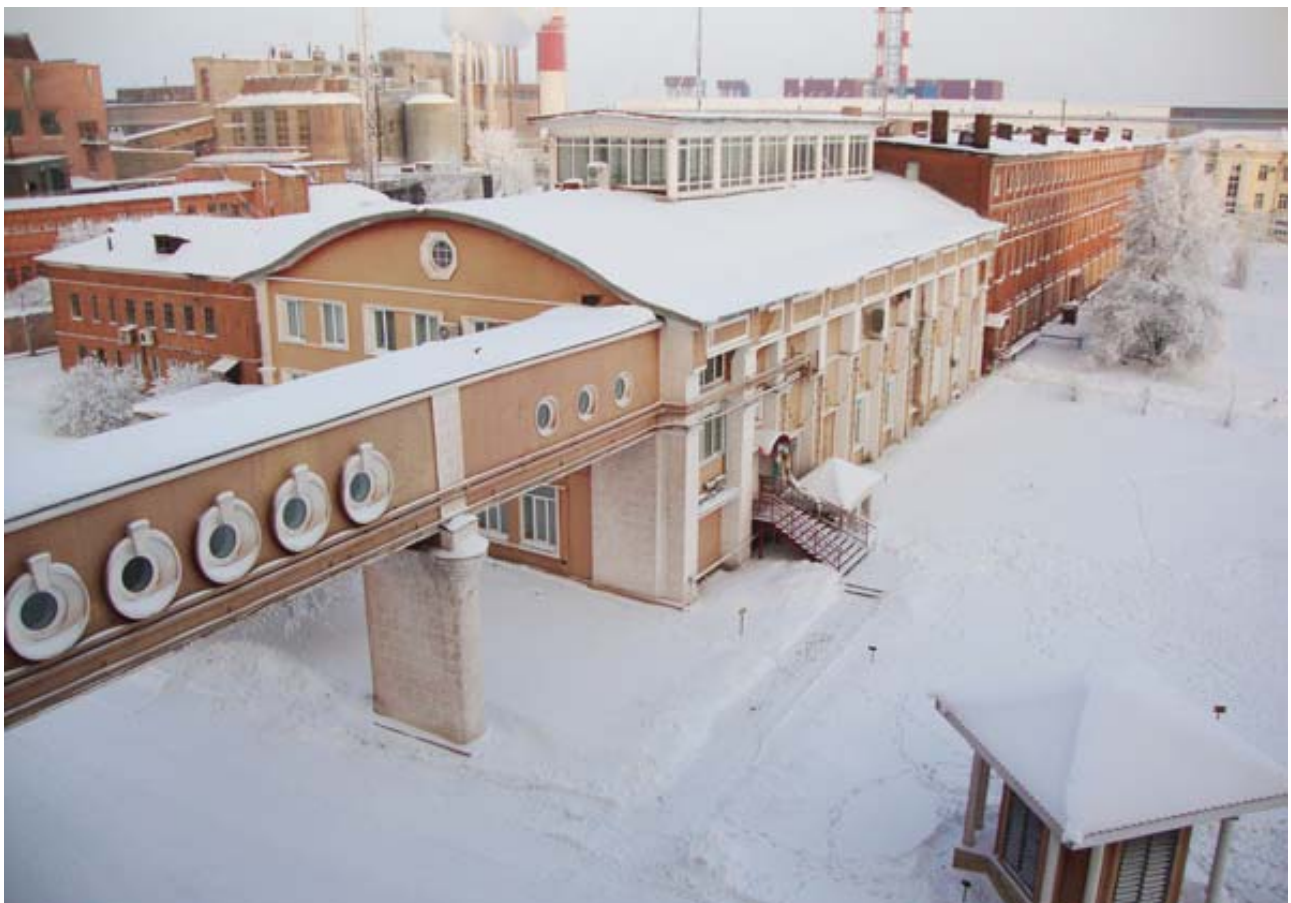
Рис. 9. Здание Главного щита управления и ГРУ, 1939 г.