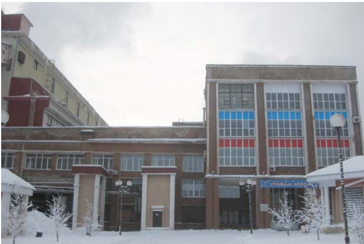
Рис.10. Здание техкорпуса, 1938 г., территория филиала ОАО «ТГК-9».