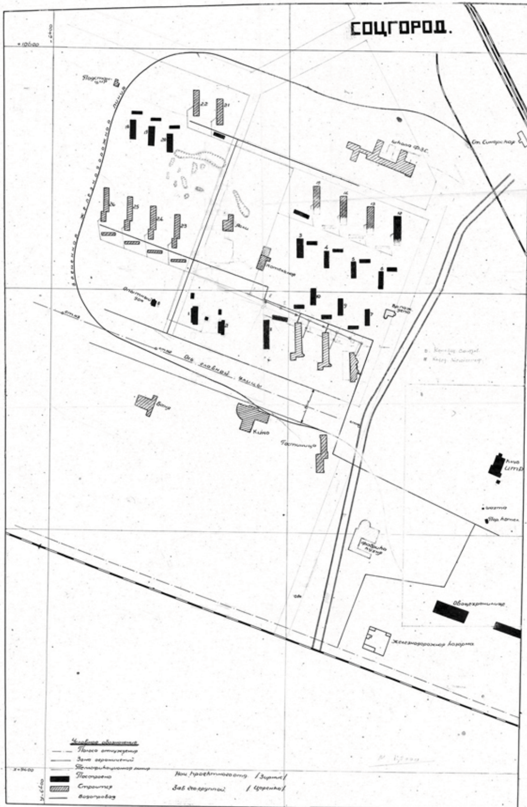
Рис. 1. Фрагмент генплана соцгорода «Трубный» 1934 г.

научно-исследовательский и проектный институт, Днепропетровск) 3 .