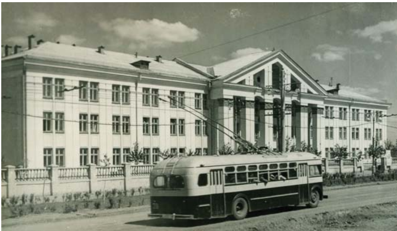
Рис. 7. Уральский алюминиевый техникум, 1957 г., ул. Алюминиевая, 60.

стороны с котельной, с западной – со зданием главного щита управления и ГРУ.