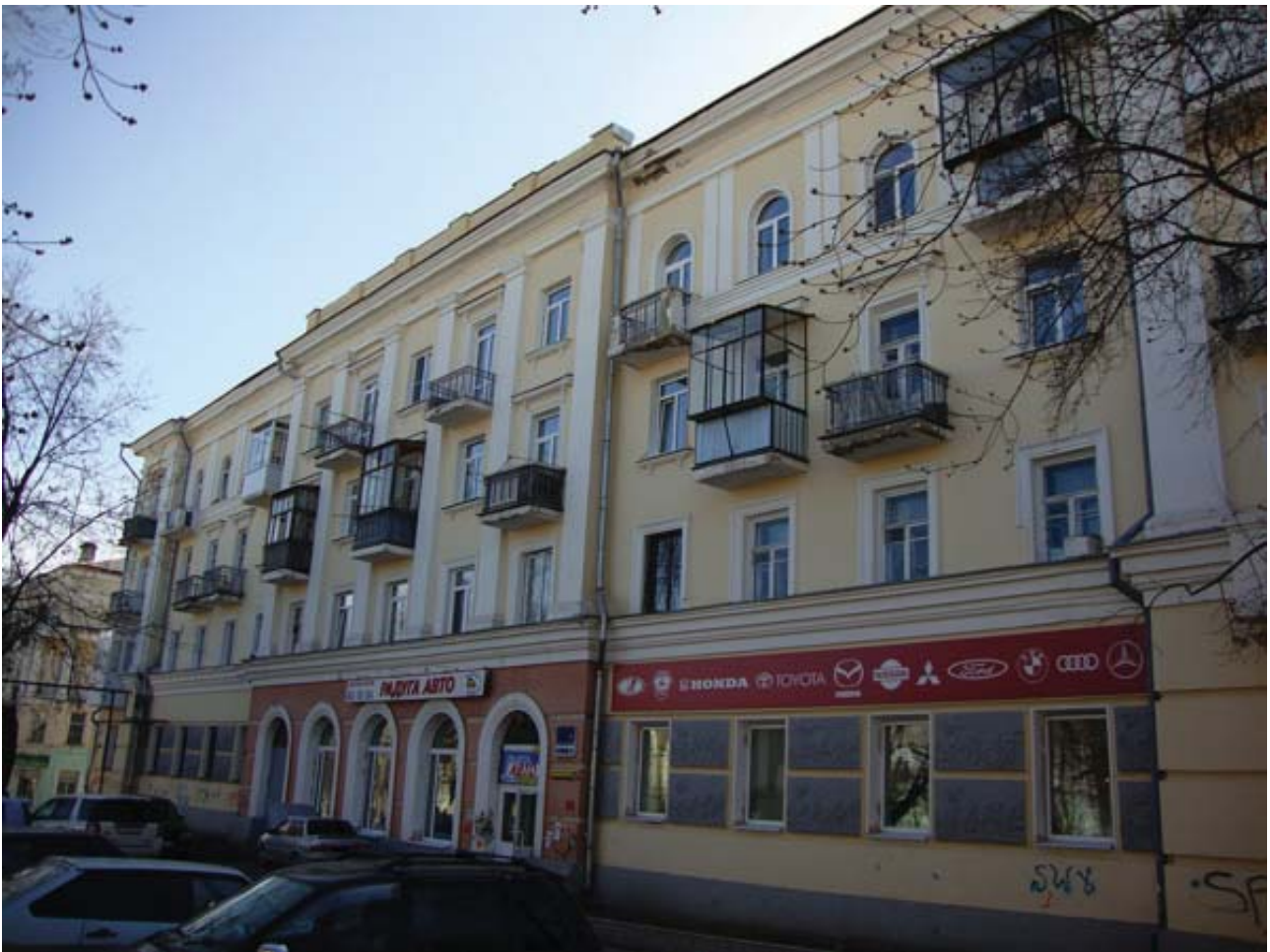
Рис. 6. Жилой дом, 1946 г., ул. Бугарева, 6.