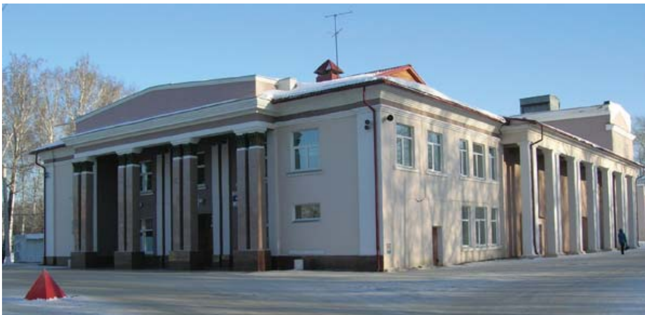
Рис. 3. Клуб Синарского трубного завода, 1945 г., ул. Карла Маркса, 62.

с юго-западной стороны зданием гостиницы для ИТР (1932–1935 гг.), с восточной – парком 6 . В 1934 г. предусматривалось функциональное деление центральной части соцгорода: с южной стороны от ул. Беляева и от площади планировалась возведение кинотеатра, бани, фабрики-кухни, с северной стороны от площади – рынка, от ул. Беляева – комплекса капитальных благоустроенных жилых домов повышенной комфортности 7 . Застройка предполагалась строчной: дома выходили торцевыми фасадами на ул. Беляева под углом к ней. Проект 1934 г. был реализован не в полном объеме. В 1935–1937 гг. из домов повышенной комфортности возвели только два: по ул. К. Маркса, 89 и ул. Беляева, 4, которые в 2001 были признаны памятниками архитектуры регионального значения 8 .