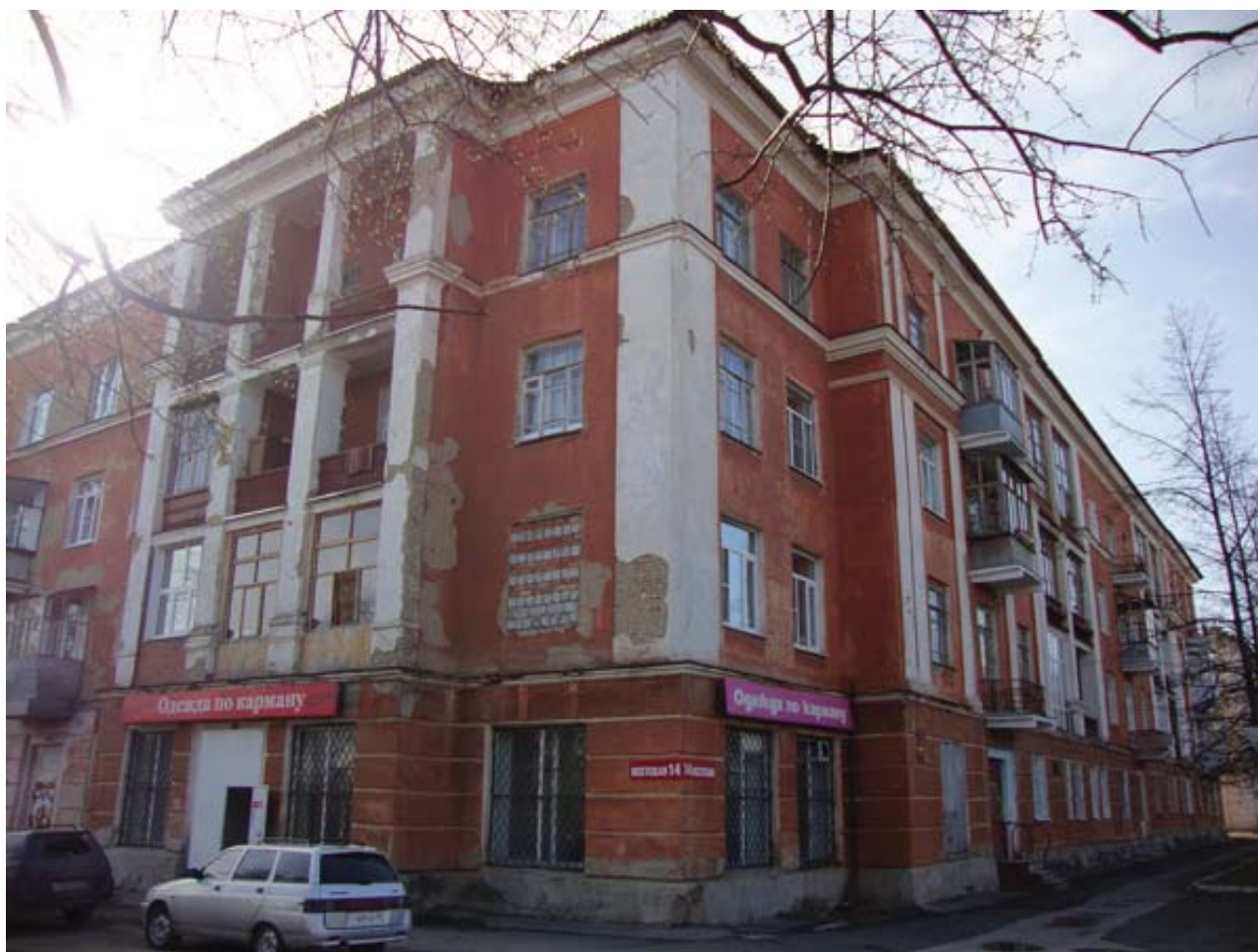
Рис. 5. Жилой дом, конец 1930-х гг., ул. Исетская, 14.

Исеть (ул. Гагарина; 1940) были признаны памятниками архитектуры в 2001 г. 15