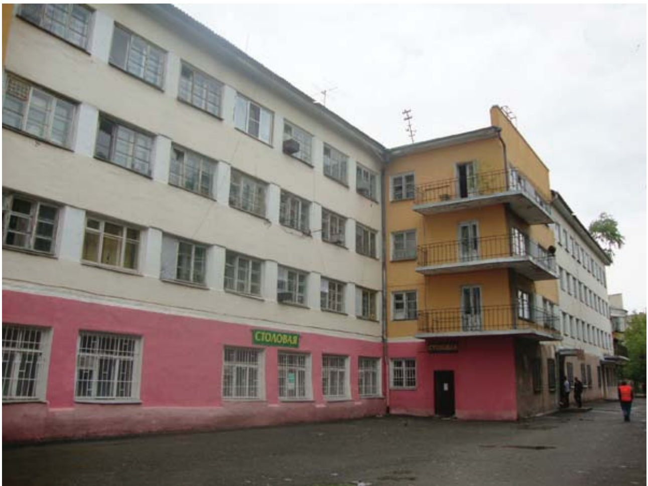
Рис. 2. Здание гостиницы для ИТР, 1932-1935 гг., ул. К. Маркса, 83.