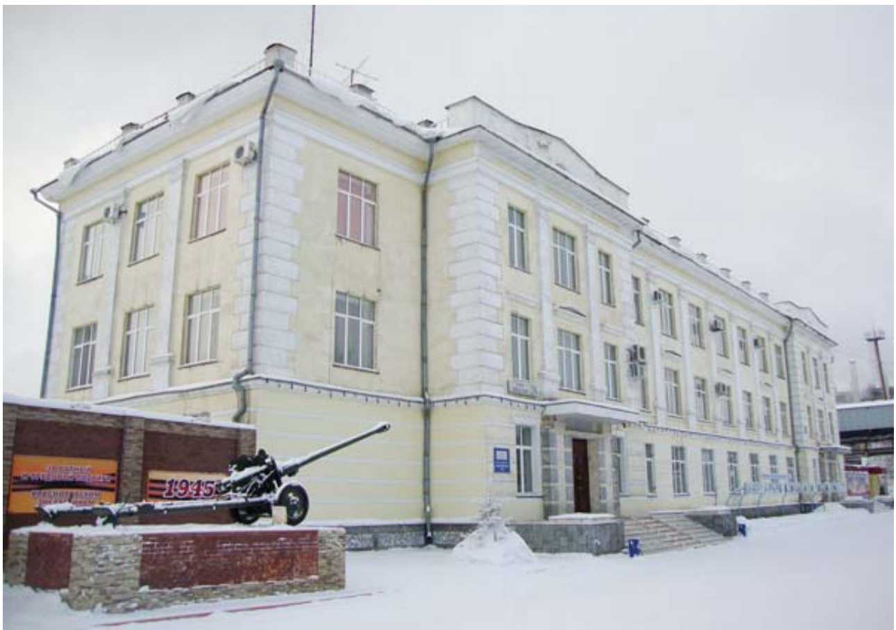
Рис. 8. Здание Главного управления Красногорской ТЭЦ, 1949, ул. Заводская, 24.