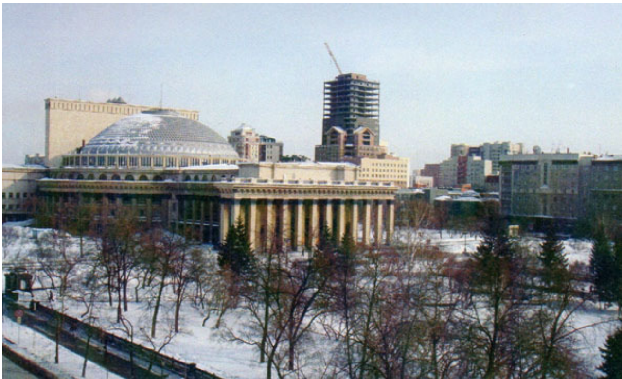
Рис. 3. Строительство новых объектов на ул. Депутатской в ансамбле площади Ленина в Новосибирске

поспешно осваиваются без наличия разработанной и утвержденной комплексной градостроительной документации, которая бы преемственно развивала основные положения утвержденного в 1973 году проекта детальной планировки центра Новосибирска (рис. 4).