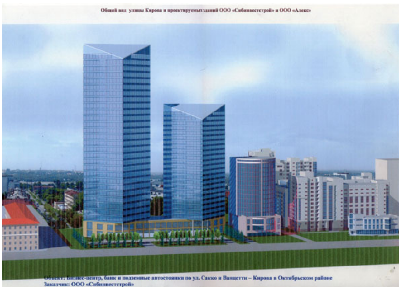
Рис. 4. Предполагаемое (принятое к реализации) строительство новых объектов на ул. Кирова в пределах нового ядра центра города Новосибирска

структурой, неповторимым Красным проспектом, феноменальными темпами развития... Несмотря на свою молодость, Новосибирск включен в перечень исторических городов России.